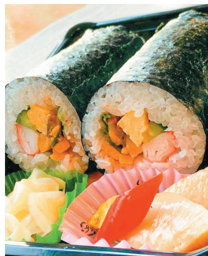
恵ほや巻ハーフ×2本 ほやピクルス、ガリ付です。

数量限定、完全予約制となります。受注数が上限に達した場合、 締め切りとさせていただきますので、お早めにご予約ください。